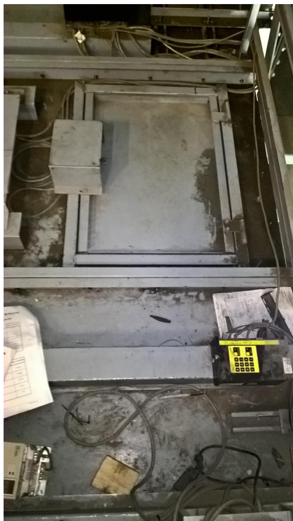
TOIT DE CABINE