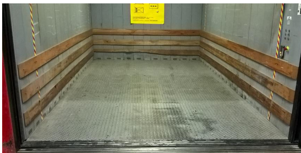
Déformation fond de cabine