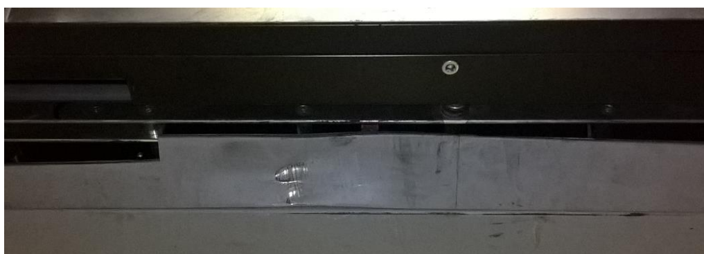
Déformation linteau cabine