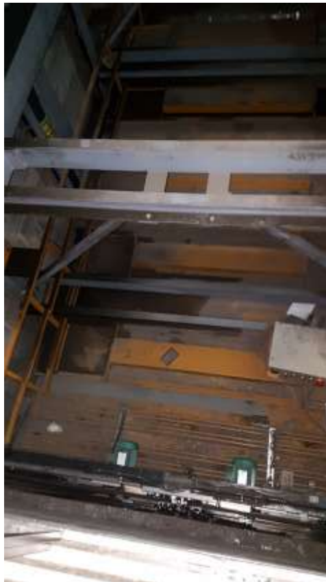
Toit de cabine Monte-charges.