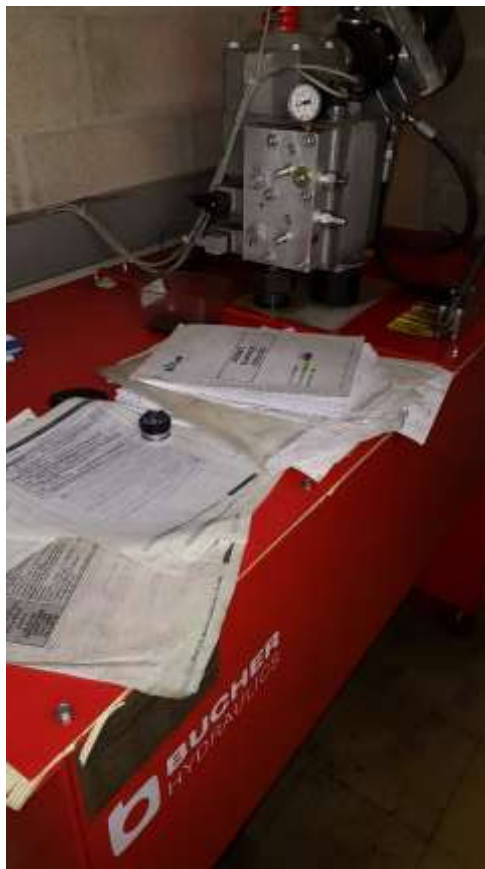
Cuve machinerie Ascenseurs.