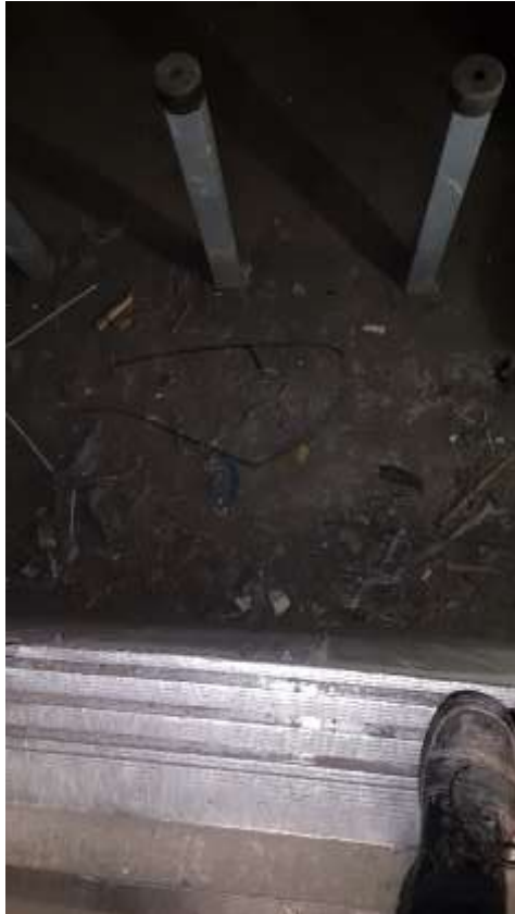
Fond de fosse Monte-charges.