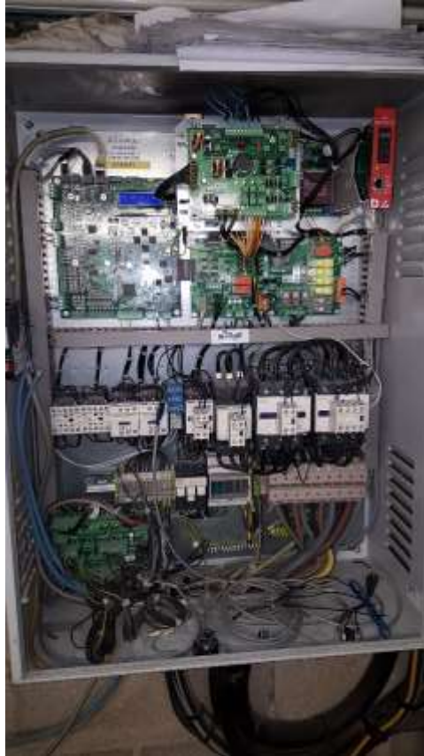
Armoire de manœuvre Ascenseurs.