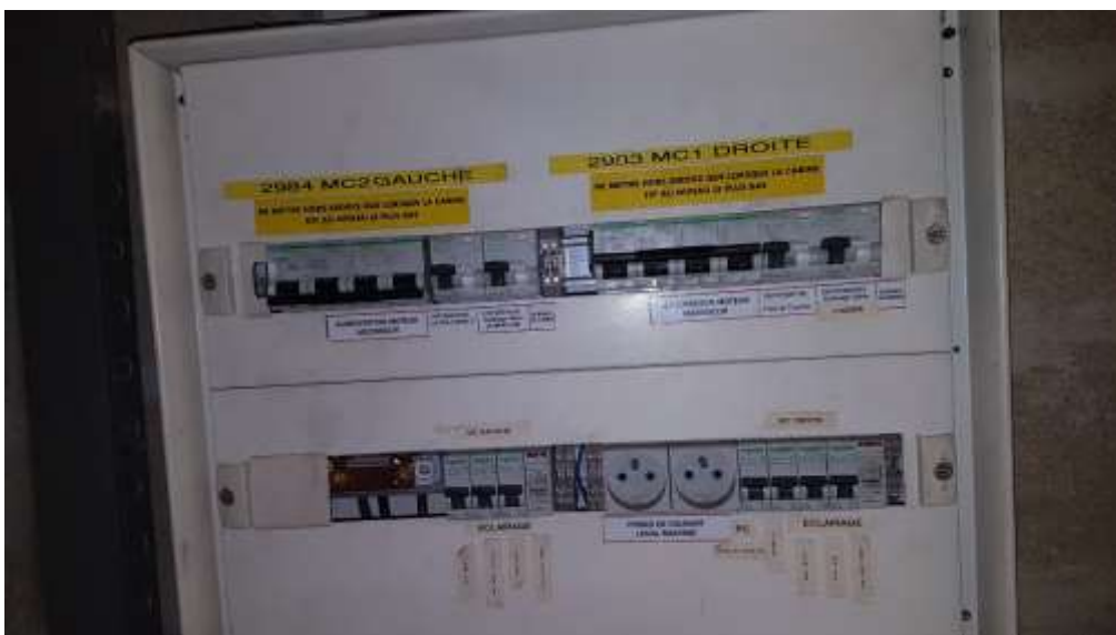
DTU Machinerie Monte-charges.