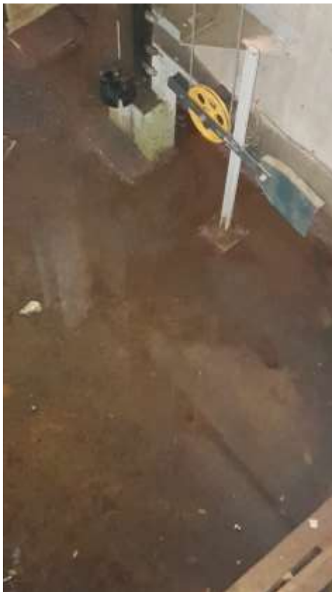
Fond de fosse Ascenseurs.