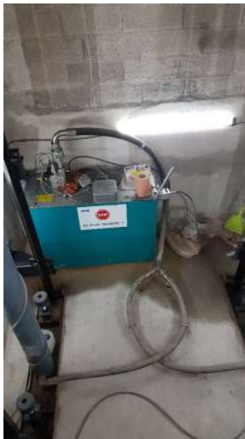
Cuve en cuvette.