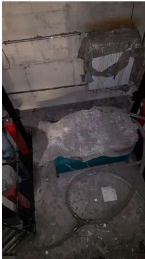
Cuve en cuvette.