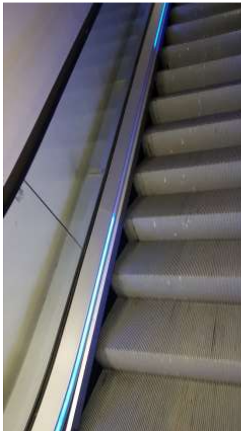
Traces sur marches escalier mécanique.