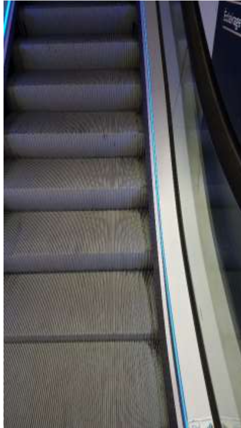
Traces d'huile sur marches.