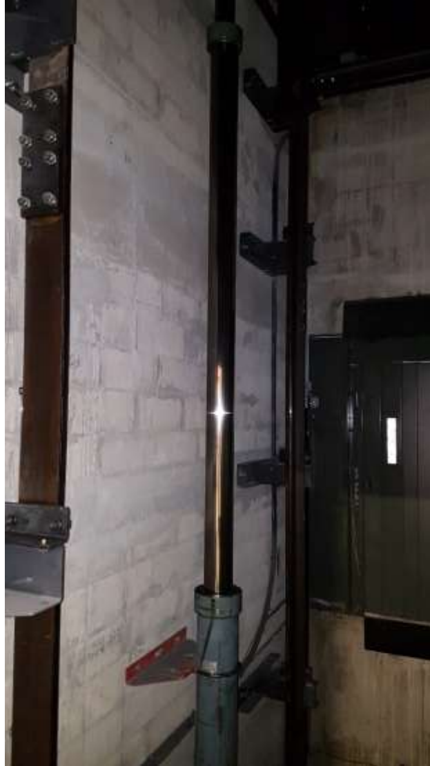
Vérin en cuvette.