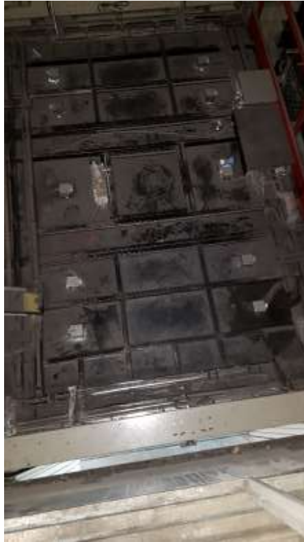
Toit de cabine.